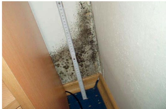
Schimmel in schlecht belüfteter Gebäudeecke hinter Möbelstück

Wohngebäude müssen laut Energieeinsparverordnung (EnEV) nahezu luftdicht sein. Gleichzeitig ist der für ein hygienisches Raumklima erforderliche Mindestluftwechsel sicherzustellen. Aufgrund von Schimmelpilzbildungen in fast luftdichten Wohngebäuden diskutiert die Fachwelt darüber, wie und durch wen die ausreichende Lüftung sicherzustellen ist. TÜV Süd Industrie Service rät zu einer ganzheitlichen Betrachtung sämtlicher Einflussfaktoren.