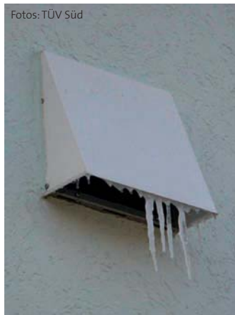
Lüftungsanlage zur Entfeuchtung eines Schlafzimmers über Nacht