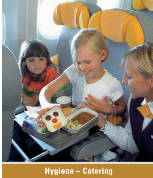
Hygiene – Catering